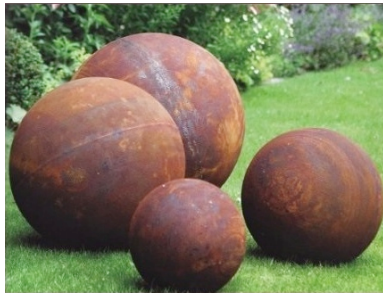
«BOWL» Vollstahl (innen hohl)

Auf Wunsch können die «BOWLS» auch bereits im Rost-Look geliefert werden. Zudem gibt es die Möglichkeit, die Kugeln in einem Farbton einbrennlackiert produzieren zu lassen.